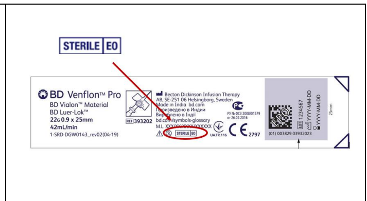
Figura 2: Imagen representativa del etiquetado del producto que indica el método de esterilización con EtO