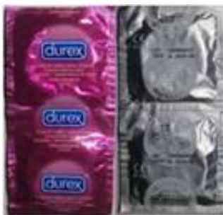
Embalaje primario producto original de color fucsia