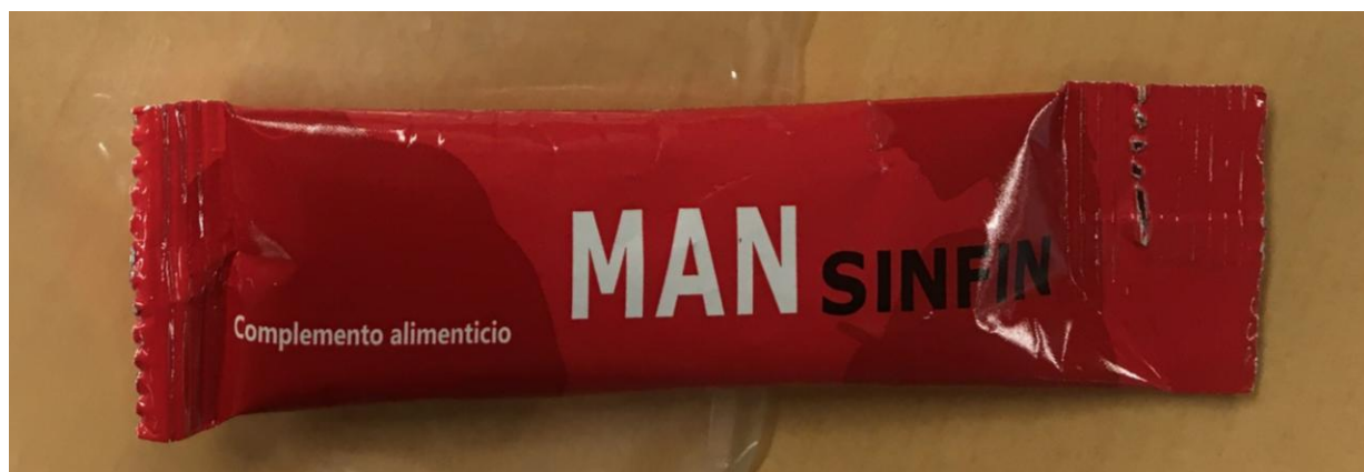
Fig.1: Imagen del producto MAN SINFIN SOBRES .

La prohibición de la comercialización y la retirada del mercado de todos los ejemplares del citado producto.